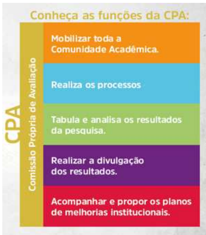
Quadro 3 – Funções CPA